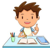
Übungen zu Inhalt und Aufbau