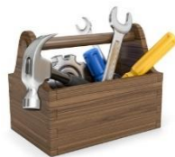
Ideen- & Stoffsammeltechniken