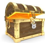
Wortschatz- und Stilübungen